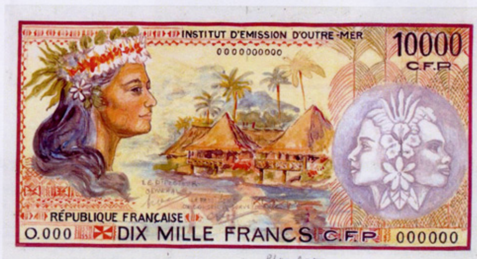
Maquette du recto

L'emblème du drapeau de la Polynésie française sera rajouté lors de l'impression.