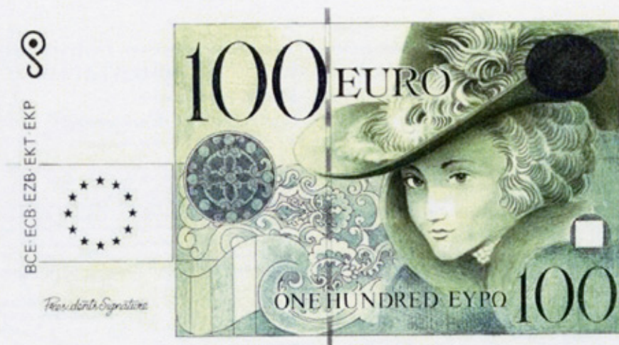
Mark SCOVELL maquette de 100 €