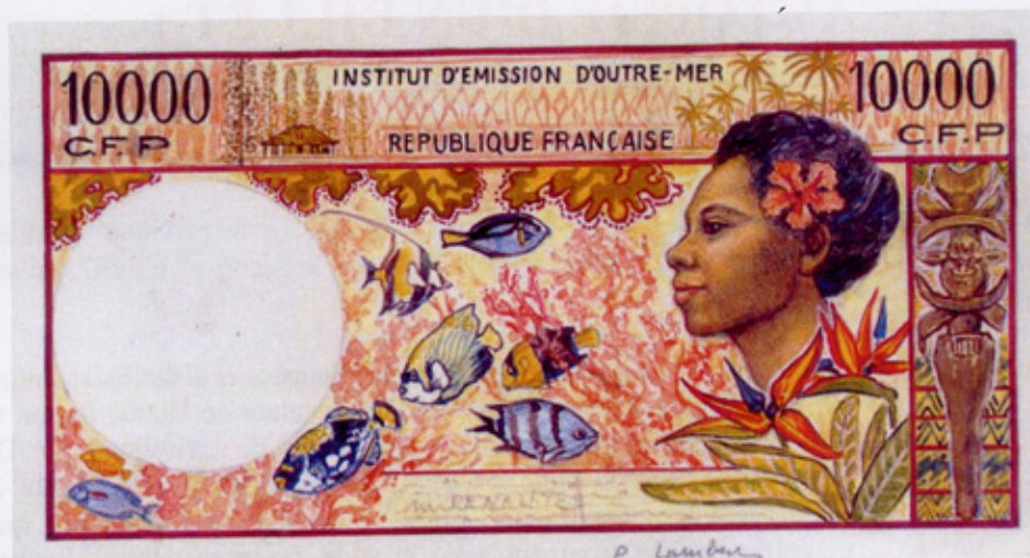
Maquette du verso

Le billet subira une modification par l'impression du nouveau code pénal et le rajout d'un fil de sécurité dans le papier.